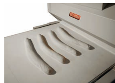
Tapis 1000 motorisé, rétractable