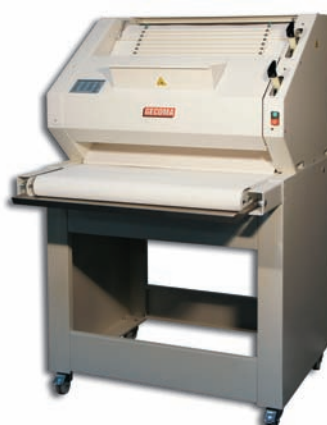
FA 2003 sur tapis 1000 sur socle