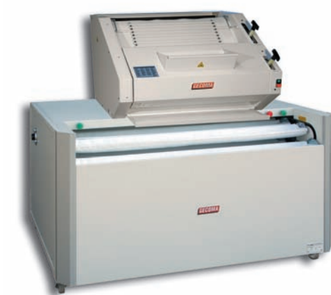
FA 2003 T sur repose-pâtons